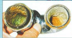
アリオレス装着後95日