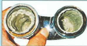
アリオレス装着前